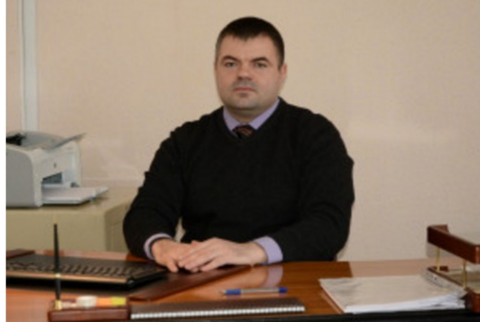
межрегиональном университете. В декабре 2013 года назначен директором ГУ «Приднестровская газета». Женат, воспитывает троих детей.

Родился 13 октября 1980 в городе Тирасполь. Окончил среднюю школу №12.