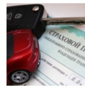
Правительству поручили к 1 октября включить в