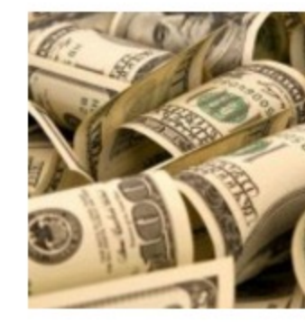
Доллар опустился ниже 65 рублей