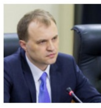
О республике из первых уст