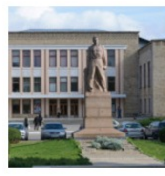
Приднестровская делегация инициировала