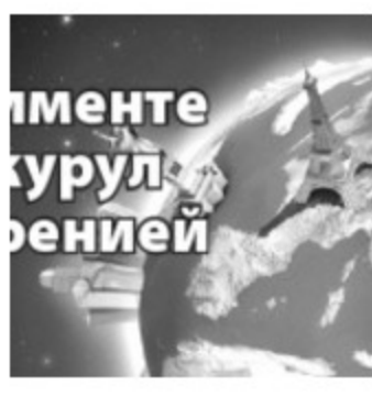
Пентру а вая проблеме май пучине, яр зиле